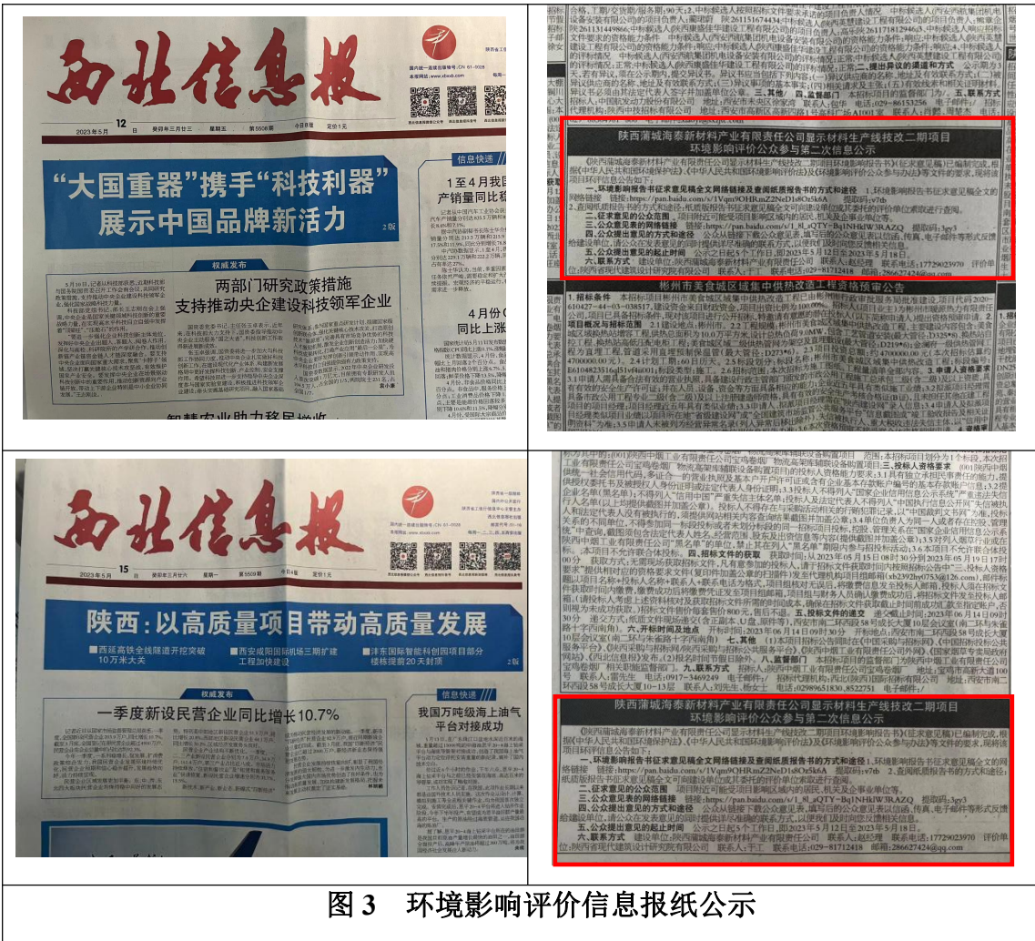
图3 环境影响评价信息报纸公示