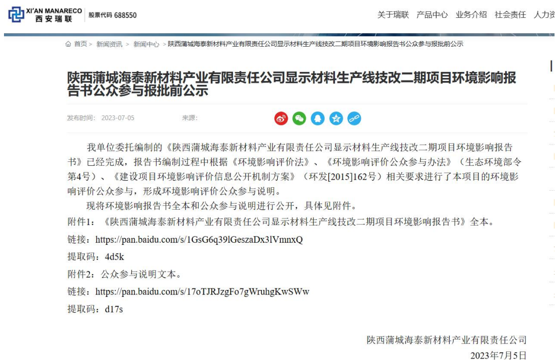
图4 项目报批前公示截图

本项目报批前公示选取的网络为西安瑞联官方网站（ http://www.xarlm.com/Newsdel/3.html ），符合《环境影响评价公众参与办法》（生态环境部令第4号）的规定，公示发表时间为2023年7月5日。公示详情如图7。