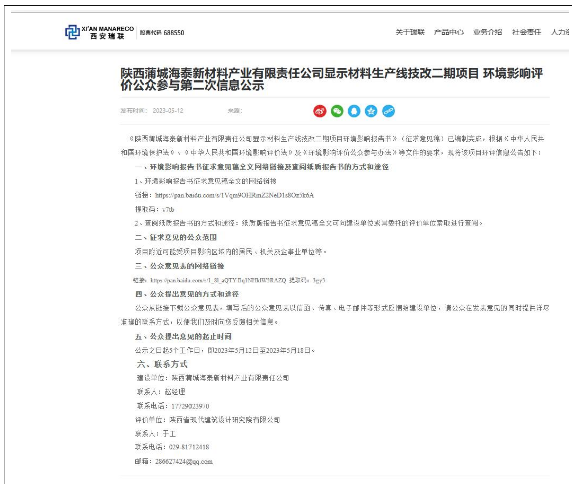
图2 环境影响评价信息二次公示

本次环境影响评价信息二次公开选取的网络为西安瑞联官网 ( http://www.xarlm.com/Newsdel/2.html ), 符合《环境影响评价公众参与办法》(生态环境部令第4号)的规定, 公示发表时间为2023年5月12日, 公众提出意见的起止时间为2023年5月12日至2023年5月18日, 共5个工作日。公示详情如图2。